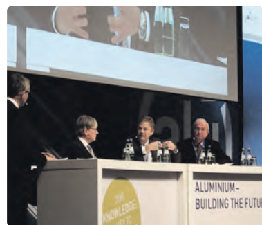
Podiumsdiskussion beim EAC

kussionen des EAC 2015 zusammen. Der Werkstoff habe sich nicht nur im Automobilbau zum innovativen Zukunftswerkstoff entwickelt, auch bei weiteren Mobilitätsanwendungen wie im Flugzeug- oder Schiffbau oder bei Schienenfahrzeugen werde die Nachfrage nach Aluminium weiter steigen. „Darüber hinaus stellt Aluminium auch in weiteren wichtigen Anwendungs-